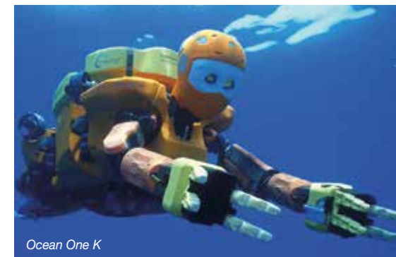
Ocean One K