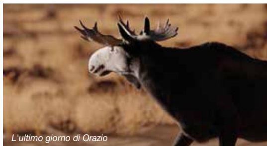
L'ultimo giorno di Orazio

Poulton-le-Fylde, Lancashire, Inghilterra, 13.000 anni fa. Una rivisitazione animata basata sulla vera storia, accuratamente documentata, delle drammatiche ultime ore di Orazio l'Alce. Lo scheletro di Horace the Elk, custodito oggi all'Harris Museum, è una delle scoperte archeologiche più importanti dell'antica Gran Bretagna. L'esame delle ossa ha rivelato 17 ferite, per lo più causate da armi con punta di selce. È stato analizzato anche il terreno attorno a Orazio per comprendere l'ambiente e