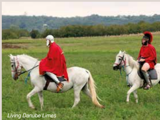
Living Danube Limes

Com'era navigare sul Danubio nell'antichità, quando il fiume rappresentava il confine del potente Impero romano, il famoso Limes? Sappiamo che i confini dell'impero erano presidiati dall'esercito romano che lo difendeva dalle selvagge tribù barbare che si trovavano dall'altra parte del Danubio. Ma che tipo di navi usavano i romani e che tipo di vita si svolgeva ai confini del potente impero? Cosa rappresentano le tavolette rinvenute sul Danubio, di cui quella di Traiano è la più famosa? E perché proprio il ponte di Traiano era considerata una delle meraviglie del mondo del suo tempo?