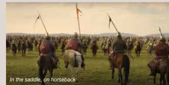
In the saddle, on horseback

Il film riporta lo spettatore al X secolo, illustrando l'arte della guerra durante la conquista ungherese del bacino dei Carpazi. Il viaggio inizia con la realizzazione delle armi stesse, guida il pubblico attraverso le loro modalità di utilizzo e si conclude con l'analisi delle campagne successive alla conquista. Interessante indagine sulle tecniche di guerra in quell'epoca.